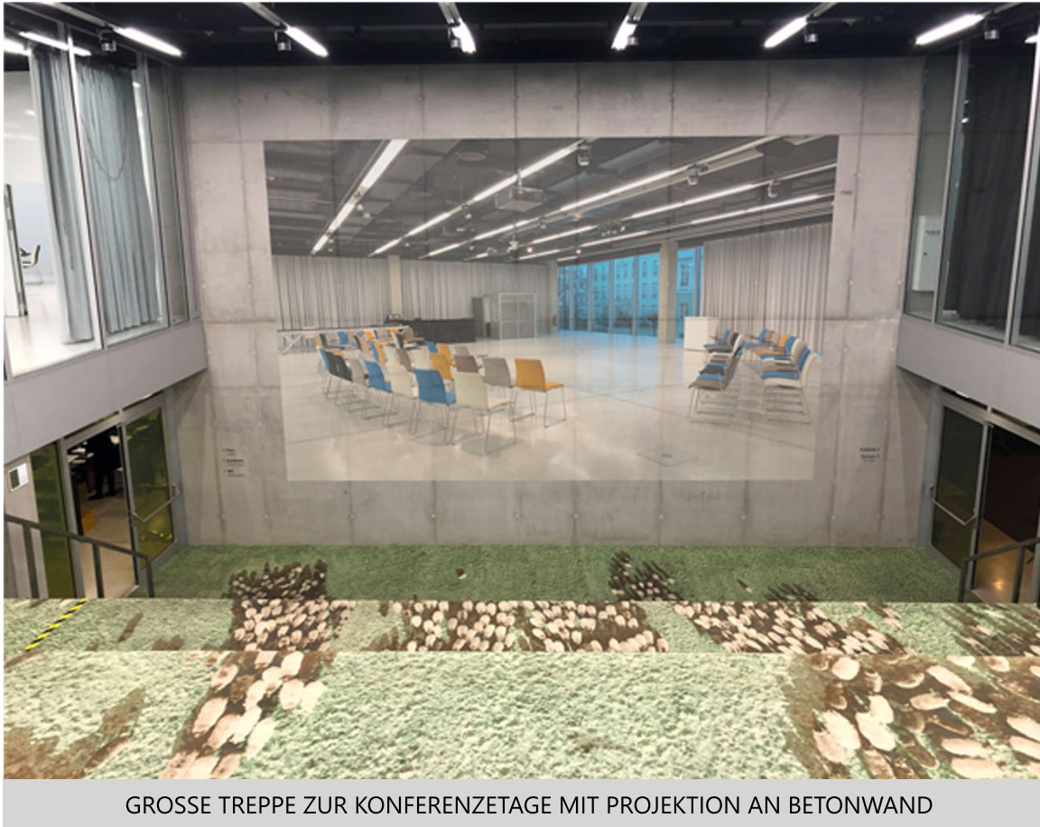
GROSSE TREPPE ZUR KONFERENZETAGE MIT PROJEKTION AN BETONWAND