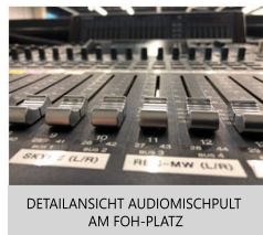
DETAILANSICHT AUDIOMISCHPULT AM FOH-PLATZ