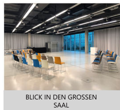
BLICK IN DEN GROSSEN SAAL