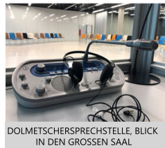
DOLMETSCHERSPRECHSTELLE, BLICK IN DEN GROSSEN SAAL